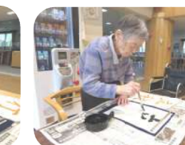
先生のお手本を見ながら練習します