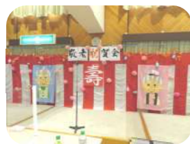
飾り付けやお食事の準備もバッチリです