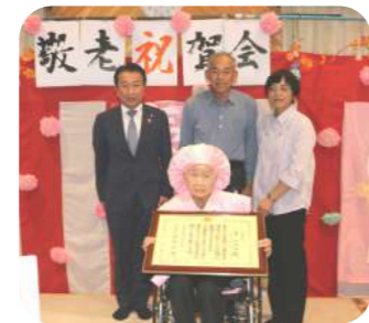
おめでとうございます