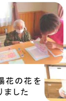
紫陽花の花を作りました