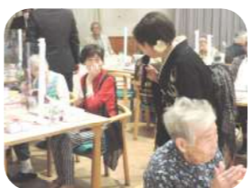
一人一人に話し掛けてくれました