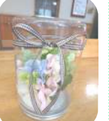
造花でアレンジメントを作りました