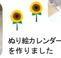
ぬり絵カレンダーを作りました