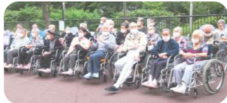
今年は屋外での盆踊りとなりました