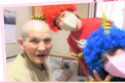
毎年恒例の豆まき!今年も職員が鬼になりすまし、入居者様には豆を手作りの鬼にまいて頂きました。皆さまとても笑顔で大変喜んでおられました!