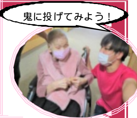
鬼に投げてみよう!