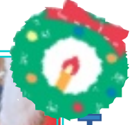
クリスマスケーキを食べるよ!