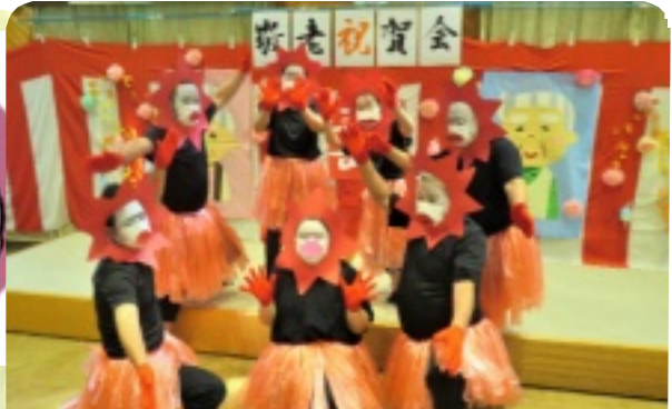
真っ赤な太陽を踊りました♪