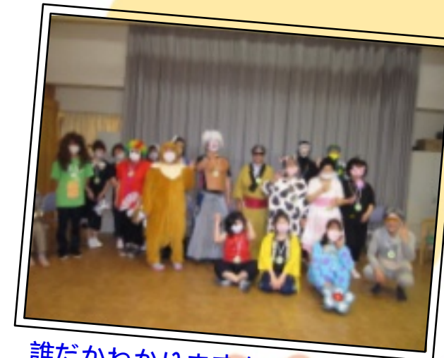
誰だかわかりますか～？