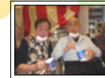
休憩時間にかき氷をパクリ おいしいですね