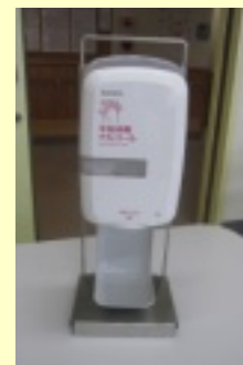
自動手指消毒器 手指消毒の徹底