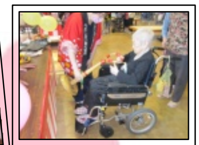
輪投げや的あて がんばりました。