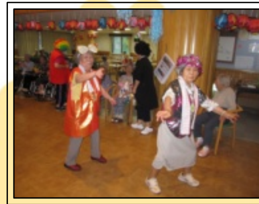
みんなで楽しく踊りました。