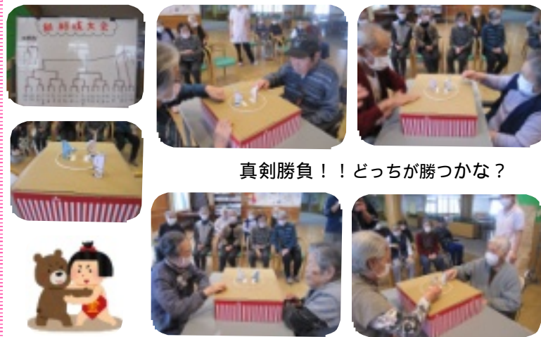
真剣勝負!! どちらが勝つか?