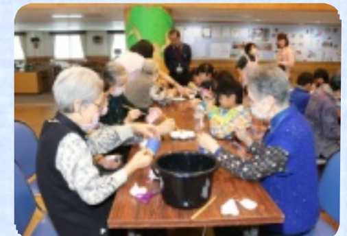
ペットボトルに色を塗っています。