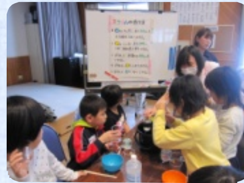
材料を計ってます

『地域住民と共生する施設づくり』と運営方針により地域の方々との交流の場を広げていくという 目的から1月10日(火)～1月13日(金)の4日間、子供たちを対象に「子供手芸の会」を実施しま した。歌志内市教育委員会、神威児童館の皆様の協力を得ながら、楽しく元気に活動する事ができま した。今後も活動や交流を通じて、地域社会の人々との絆を強めることを目指します。