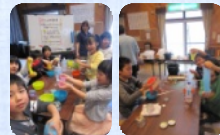
ヤッター!のびのびスライム!