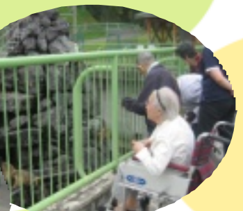
お猿さんに餌やりです