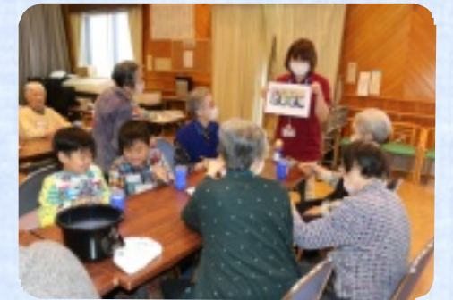
子供たちと一緒にペンギンづくりです。