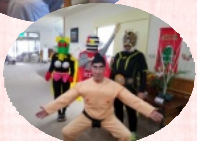
電線音頭だよ! 誰かわかるかな?