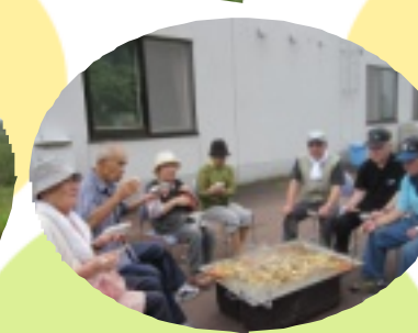
ゴルフの後のジンギスカン