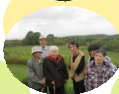
コスモスの前で一枚