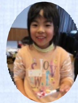
デコペン可愛くできました。