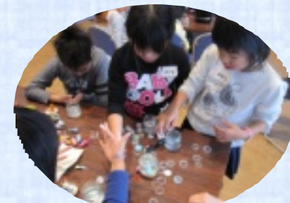
スノードーム作ってます。